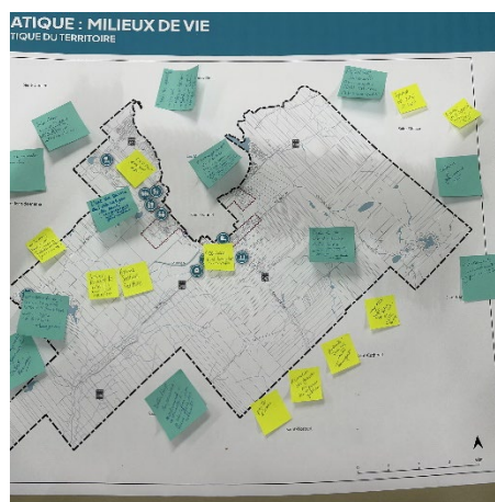
De haut en bas : Espace « S'informer » / Les cartes et les notes citoyennes sur les thématiques « Économie », « Environnement et paysage », « Mobilité » et « Milieux de vie »